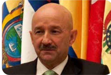
Carlos Salinas de Gortari