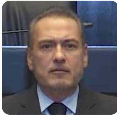
Manlio Fabio Beltrones