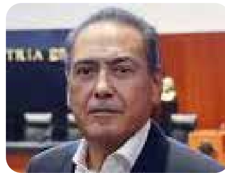
Manlio Fabio Beltrones