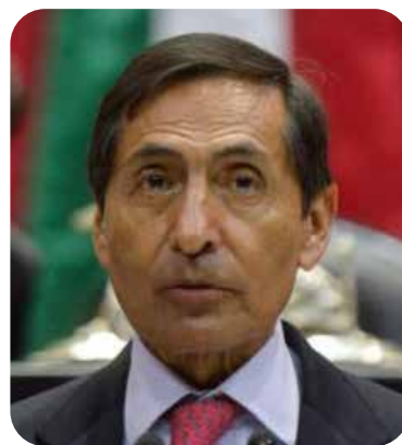
Gerardo Fernández Noroña