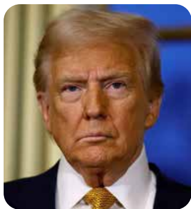
Alejandro Gertz Manero